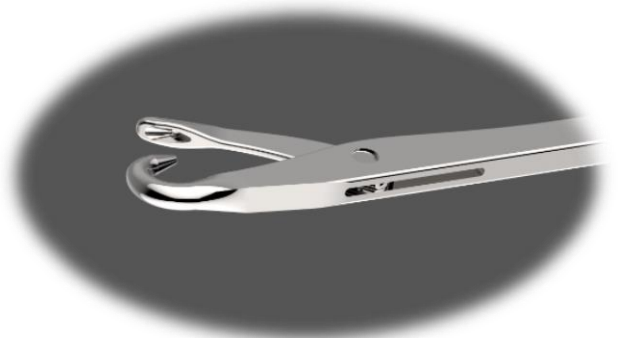
Single Jersey Nadeln auf höchstem Qualitätsniveau