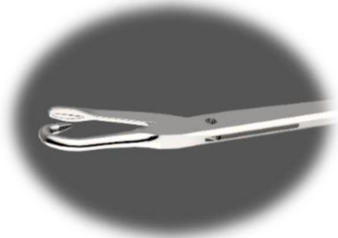
Socken Nadeln auf höchstem Qualitätsniveau.